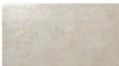
Way Gris 31,6x59,2