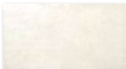
Way Marfil 31,6x59,2